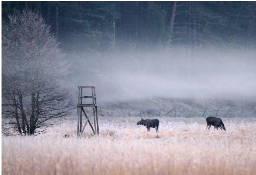
Älg Alces alces