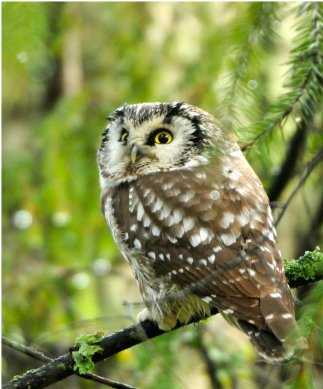
Pärluggla Aegolius funereus