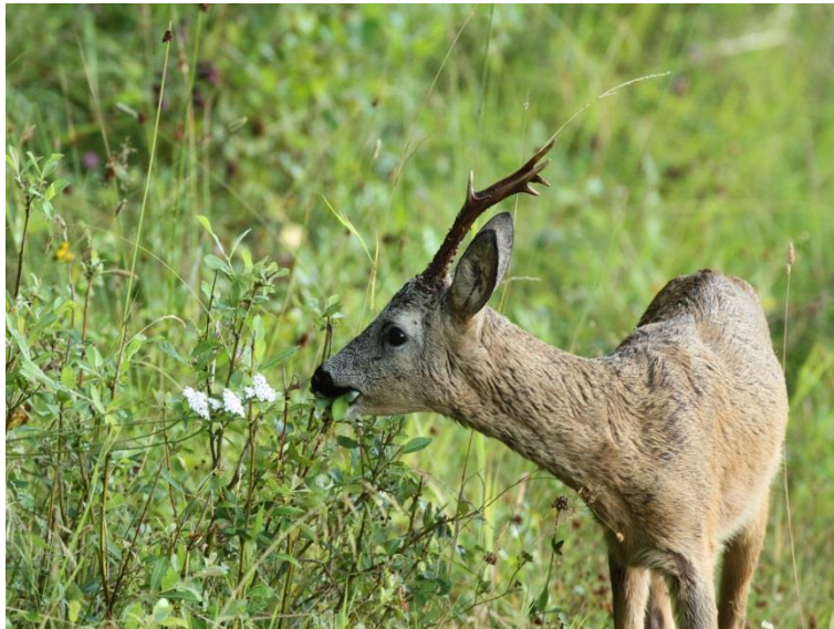
Rådjur Capreolus capreolus