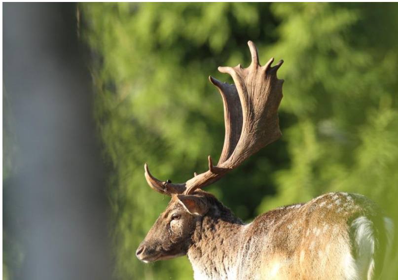
Dovvilt Dama dama